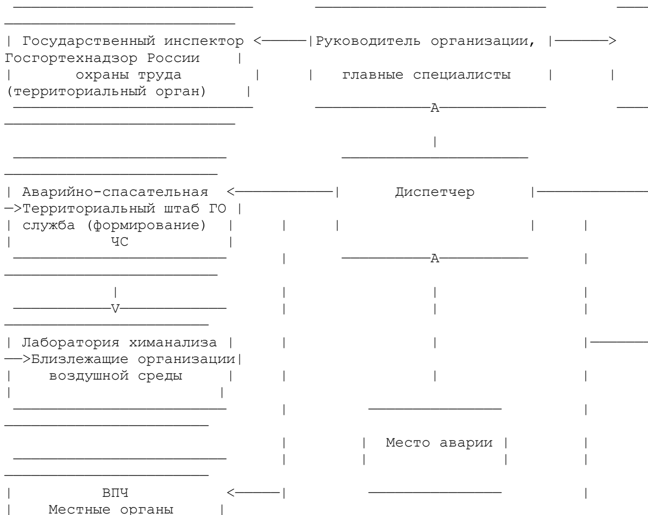
Схема оповещения об аварийной ситуации (пример)